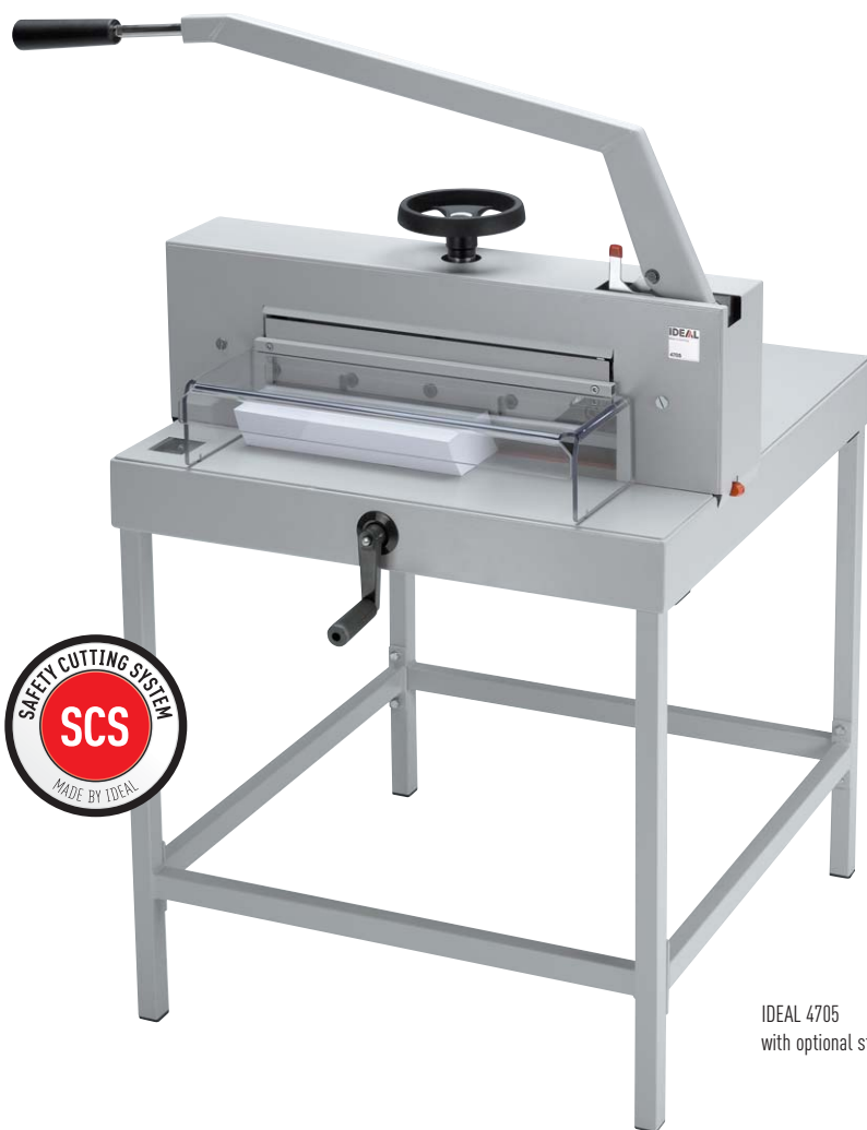
IDEAL 4705 with optional stand